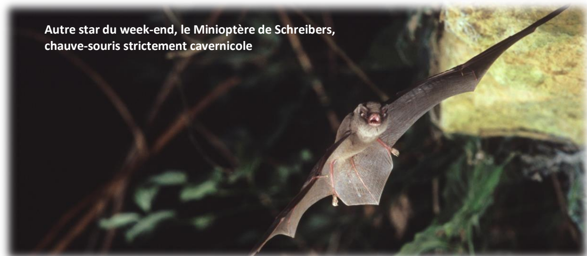
Autre star du week-end, le Minoptère de Schreibers, chauve-souris strictement cavernicole