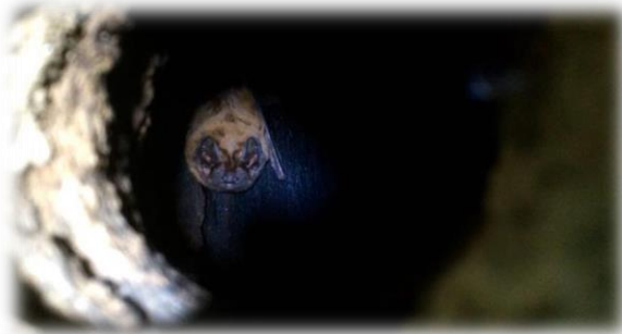
La Grande Noctule, star du week-end !