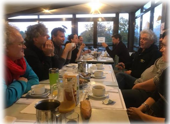
8h du mat... le 2 ème jour attaque fort ! Discussion animée sur les statistiques autour du petit déjeuner. La courte nuit a porté conseils.