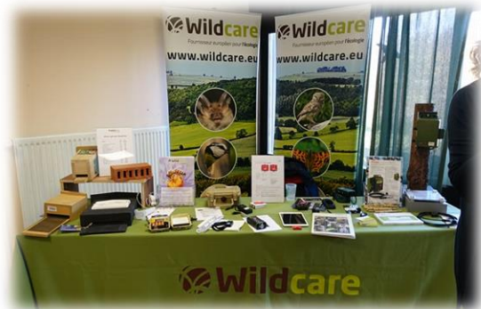
Des stands sur les techniques d'études ou du matériel spécifique (détecteurs, gîtes artificiels)