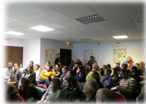
Les ateliers, sur le swarming pour celui-ci, ont eu beaucoup de succès !